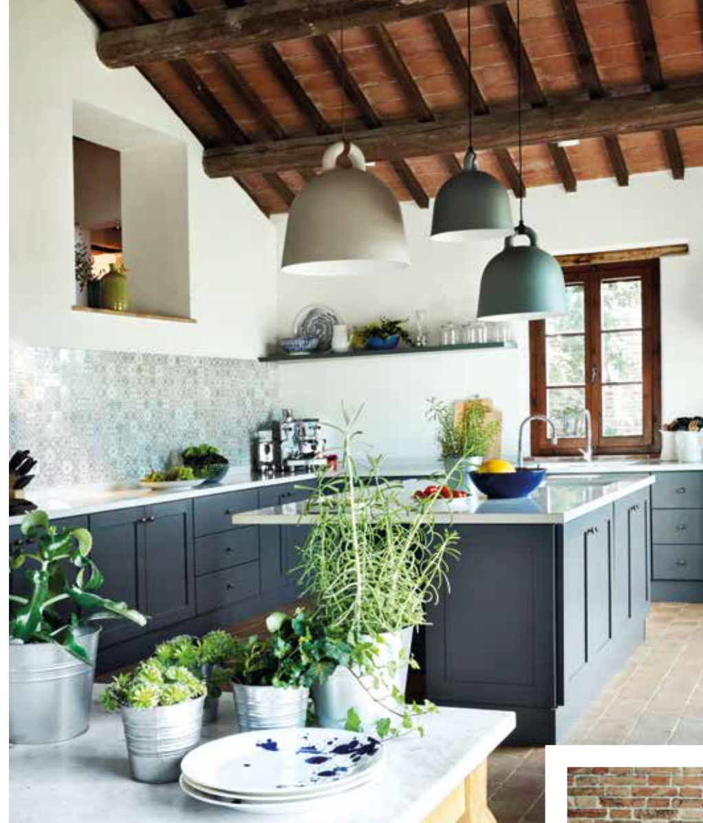
A SINISTRA, E A FIANCO, DUE VEDUTE DELLA CUCINA MODERNA REALIZZATA DA ABILI ARTIGIANI DEL LUOGO E IN BASSO, L'APERTURA VERSO IL GIARDINO. LEFT AND ALONGSIDE, TWO VIEWS OF THE MODERN KITCHEN CREATED BY SKILLED LOCAL CRAFTSMEN AND BOTTOM, THE OPENING TO THE GARDEN