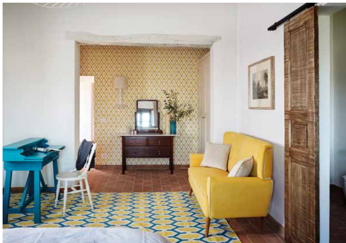
IN ALTO, L'AMBIENTE BAGNO SEPARATO DA UNA PORTA SCORREVOLE CHE LO UNISCE ALLA CAMERA PADRONALE. IN BASSO, UN ANGOLO DELLA STESSA CAMERA CON SCRITTOIO. TOP THE BATHROOM SEPARATED BY A SLIDING DOOR THAT JOINS IT TO THE MASTER BEDROOM. BOTTOM, A CORNER OF THE SAME ROOM WITH A DESK.

ginaria struttura (il vecchio B&B era diviso in 3 mini appartamenti). Ora Bellaria è pronta per scrivere una nuova storia. I due progettisti, insieme all'architetto Piero Sacco dello studio SPR di Tavernelle di Panicale, si sono messi al lavoro all'inizio di gennaio dello scorso anno. Alla fine di luglio la casa era pronta per accogliere i primi ospiti. Il progetto è stato realizzato grazie a un gruppo di professionisti e artigiani molto motivati che è difficile trovare altrove. Bellaria oggi si presenta come un immobile antico, ma pronto per essere apprezzato e goduto da una nuova generazione.