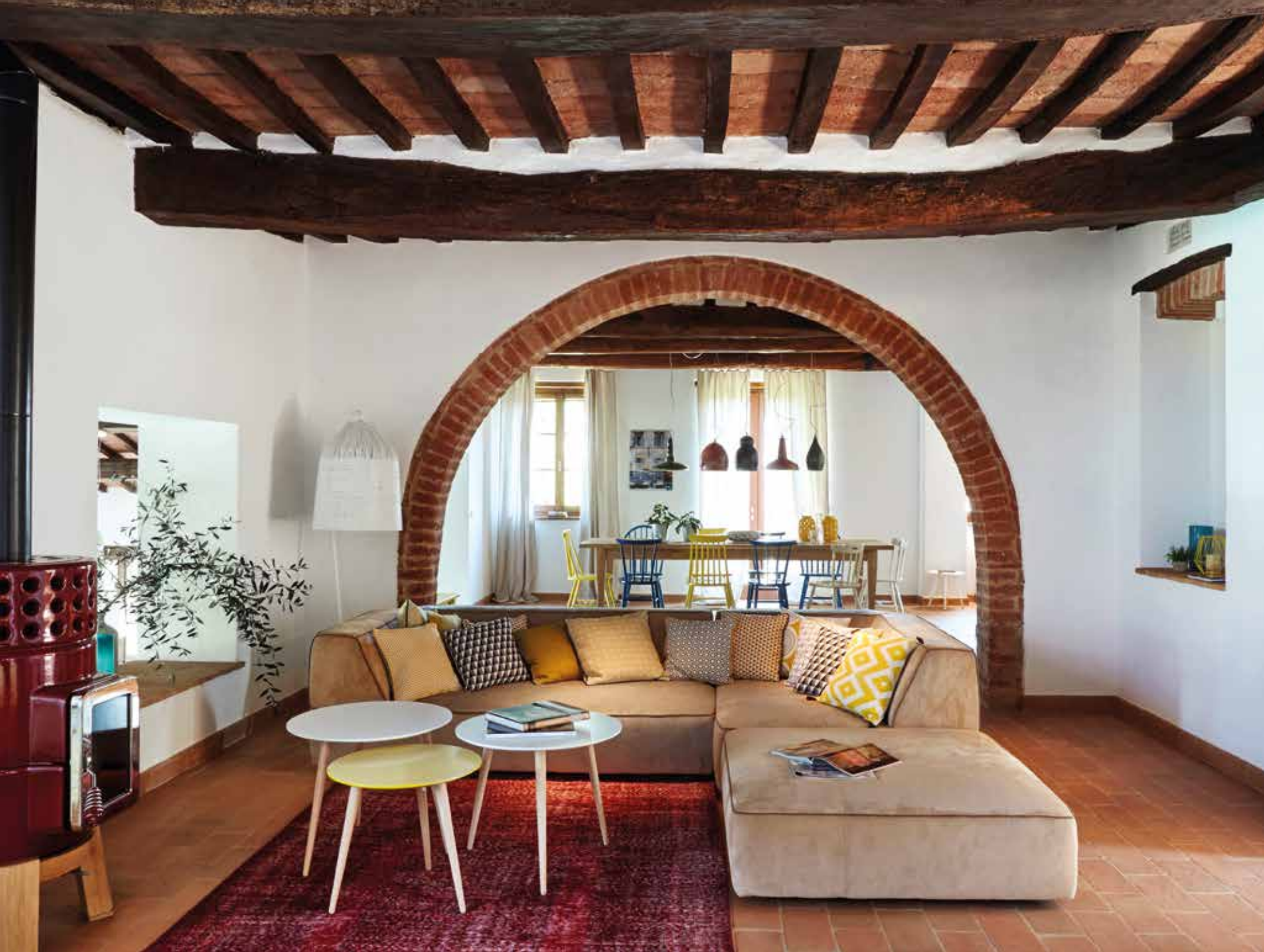
A SINISTRA, IL PIÙ IMPORTANTE INTERVENTO ARCHITETTONICO. A DESTRA, UN ANGOLO DI CONVERSAZIONE E IN BASSO, IL COLLEGAMENTO CON LA ZONA NOTTE. LEFT, THE MOST IMPORTANT ARCHITECTURAL INTERVENTION. RIGHT, A SOCIAL CORNER AND BOTTOM, THE CONNECTION WITH THE BEDROOM.