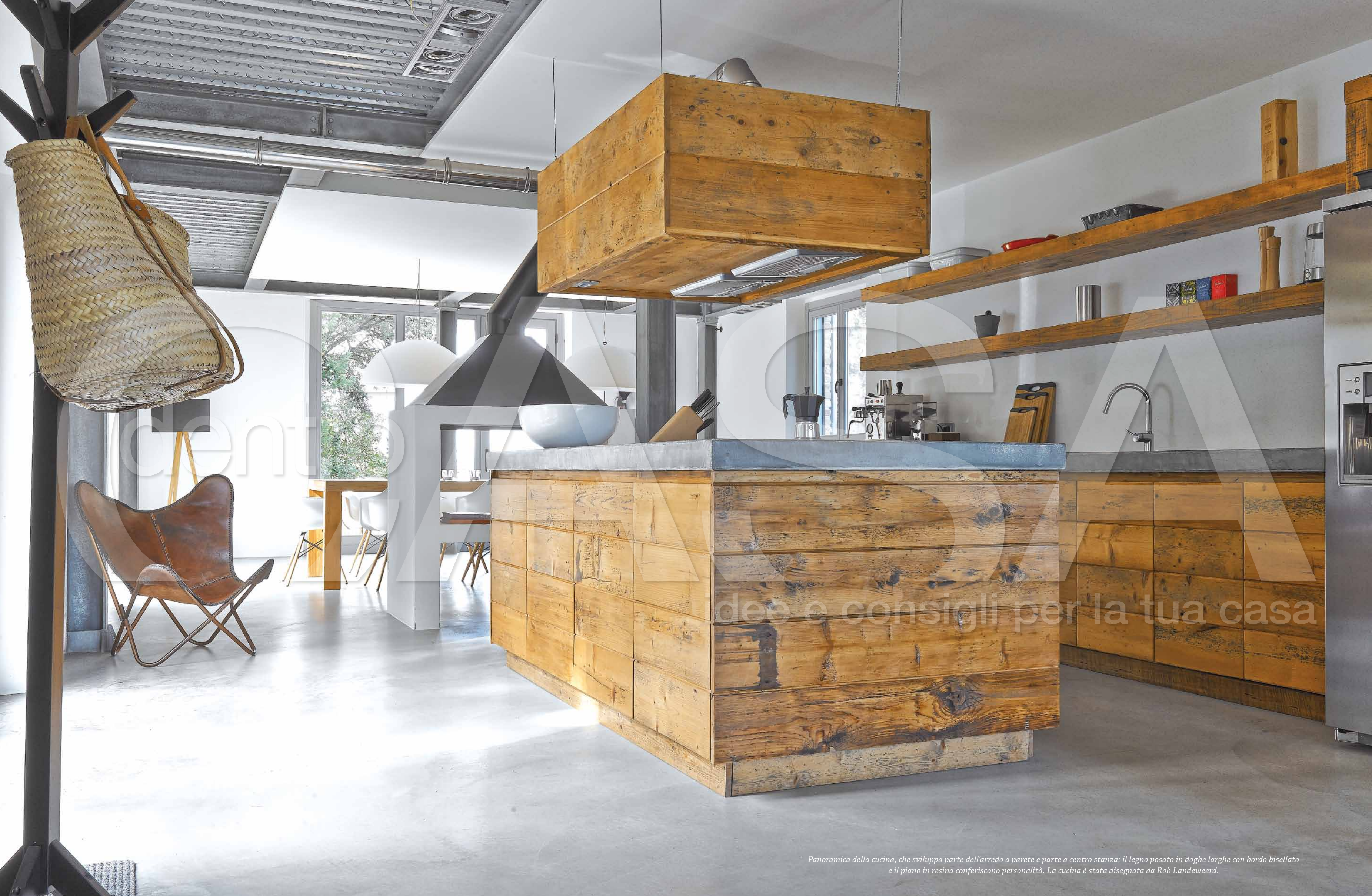
Panoramica della cucina, che sviluppa parte dell'arredo a parete e parte a centro stanza; il legno posato in doghe larghe con bordo bisellato e il piano in resina conferiscono personalità. La cucina è stata disegnata da Rob Landeweerd.