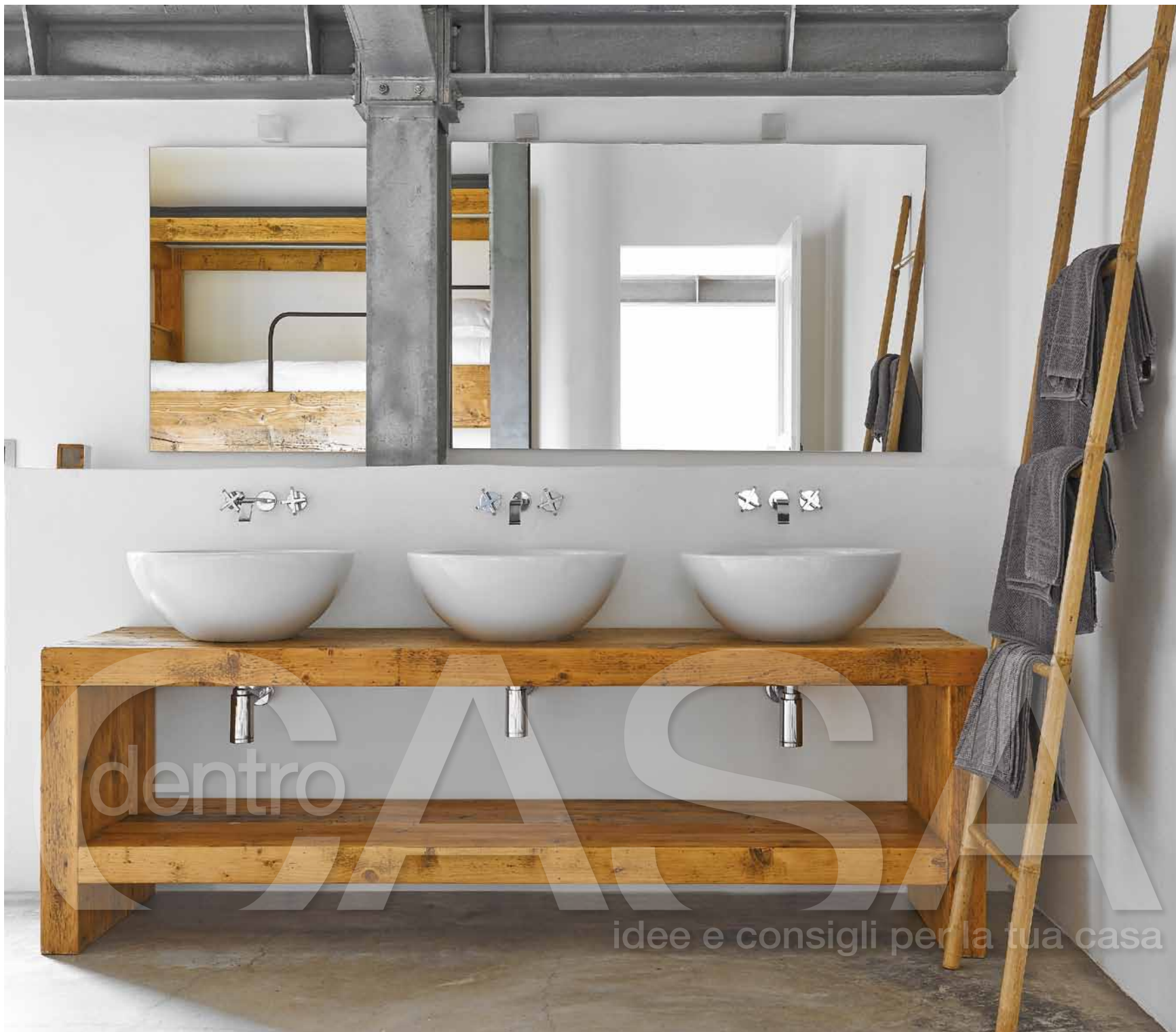
Un altro bagno della villa, completamente aperto sulla camera adiacente; anche qui si è giocato sul contrasto tra la struttura rigorosa e l'arredo caldo e lineare.