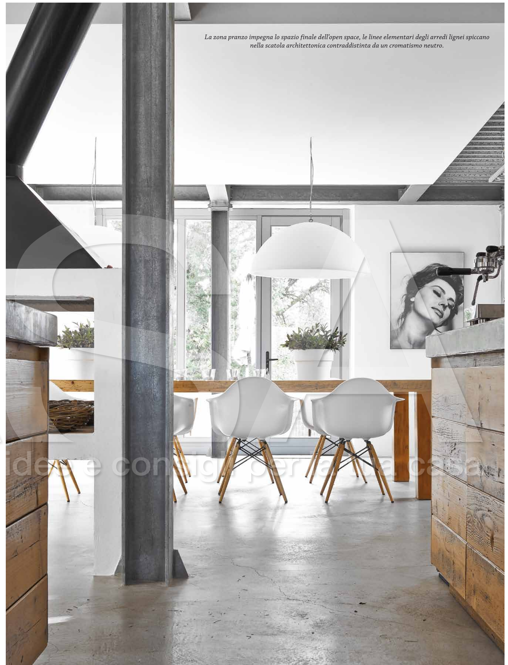
La zona pranzo impegna lo spazio finale dell'open space, le linee elementari degli arredi lignei spiccano nella scatola architettonica contraddistinta da un cromatismo neutro.