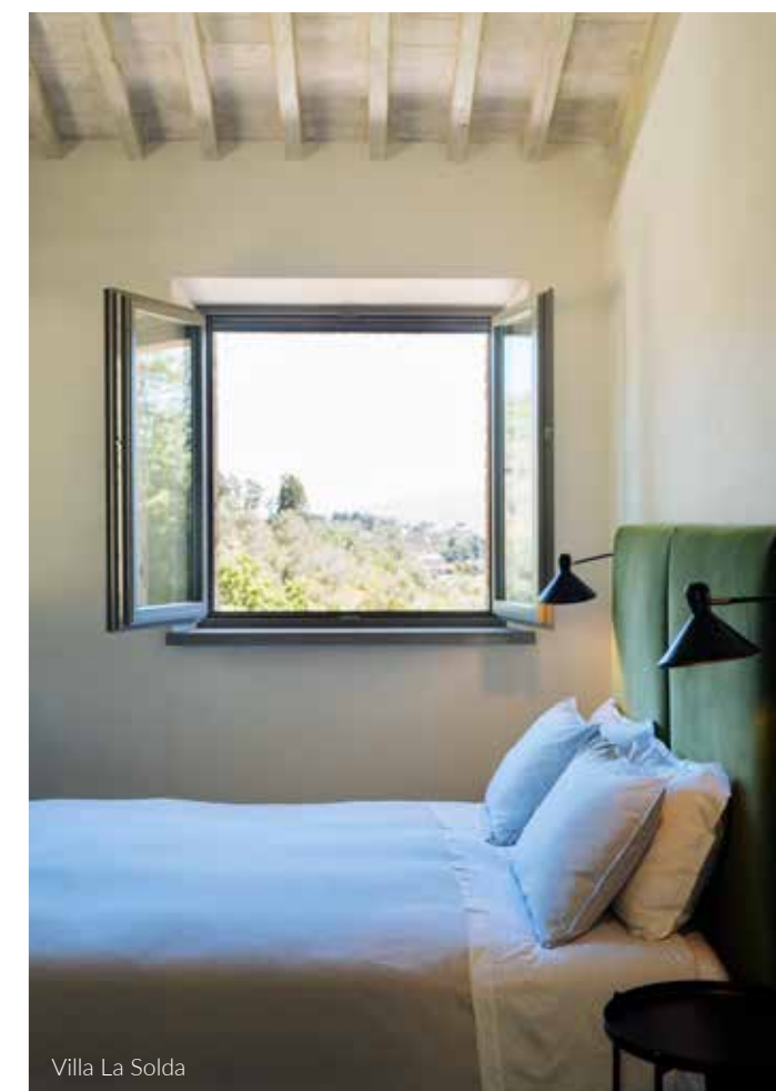
Villa La Solda

'We droomden al langer van een nieuwe start in een ander land en nu werd het ineens heel concreet'