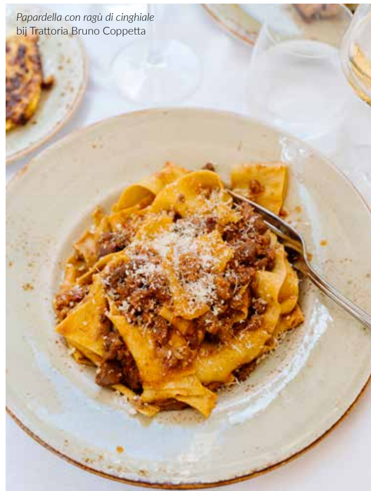
Papardella con ragù di cinghiale bij Trattoria Bruno Coppetta