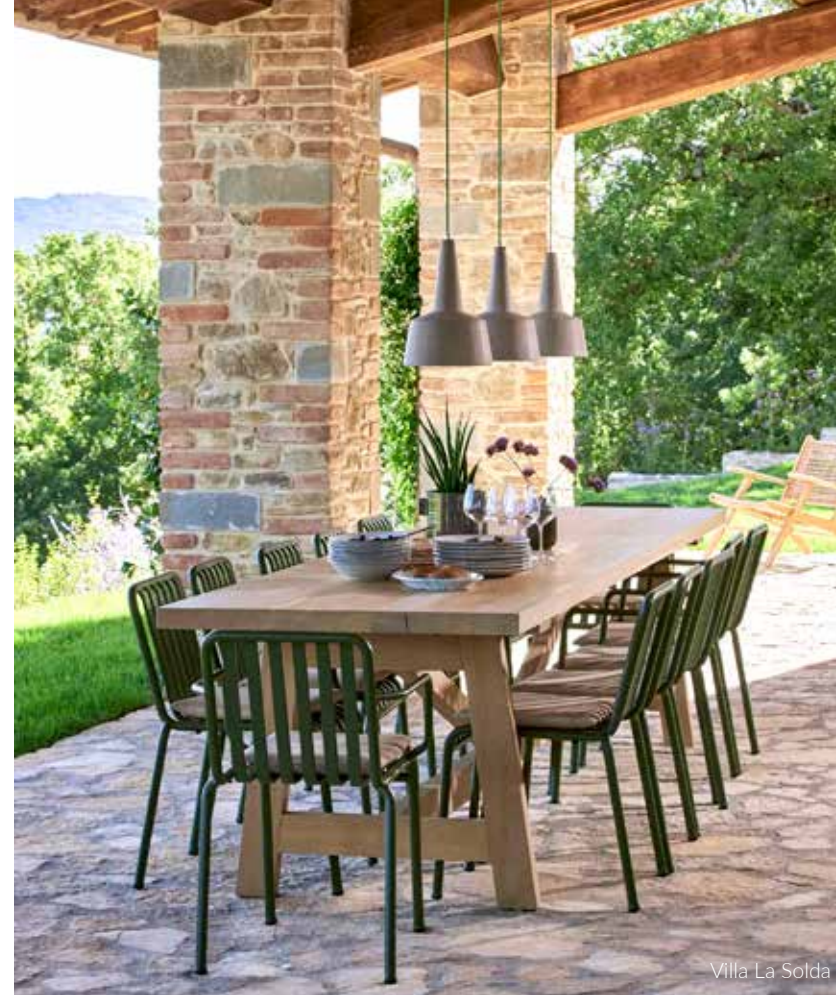
Villa La Solda

‘Sommige klanten zien een ruïne liggen en bellen dan of wij die voor ze kunnen kopen’