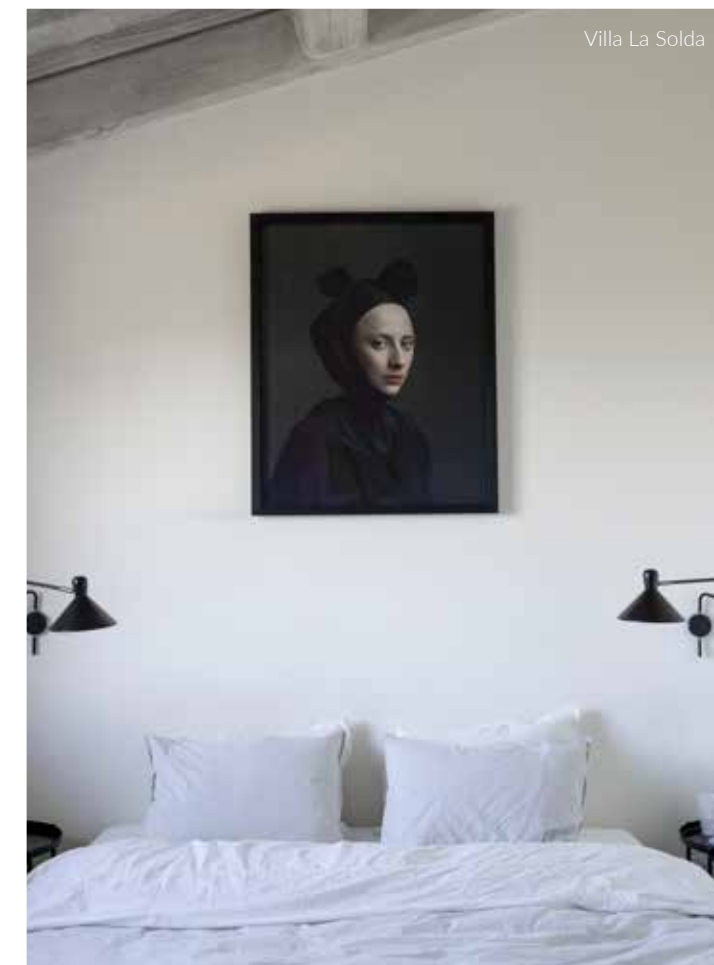
Villa La Solda