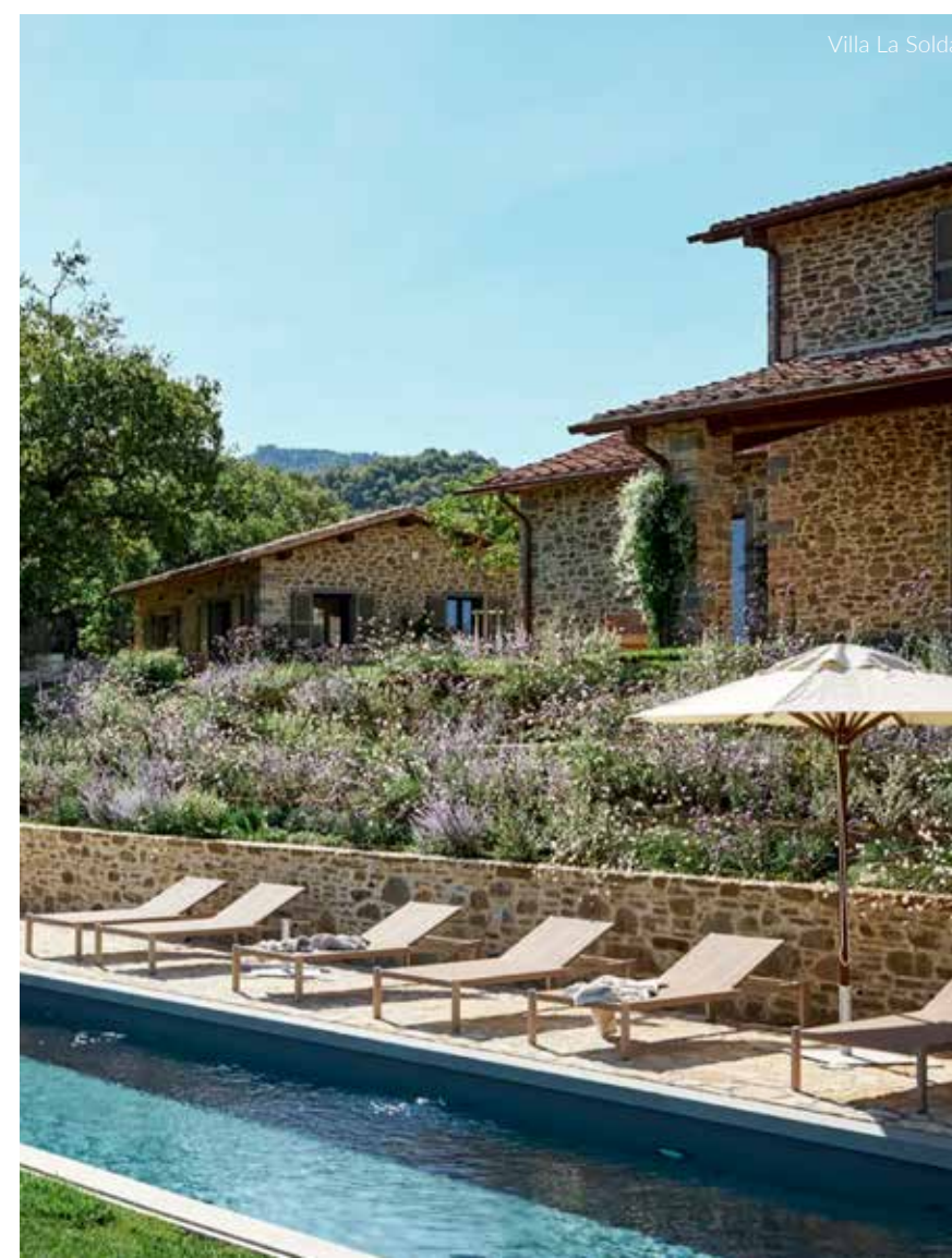
Villa La Solda