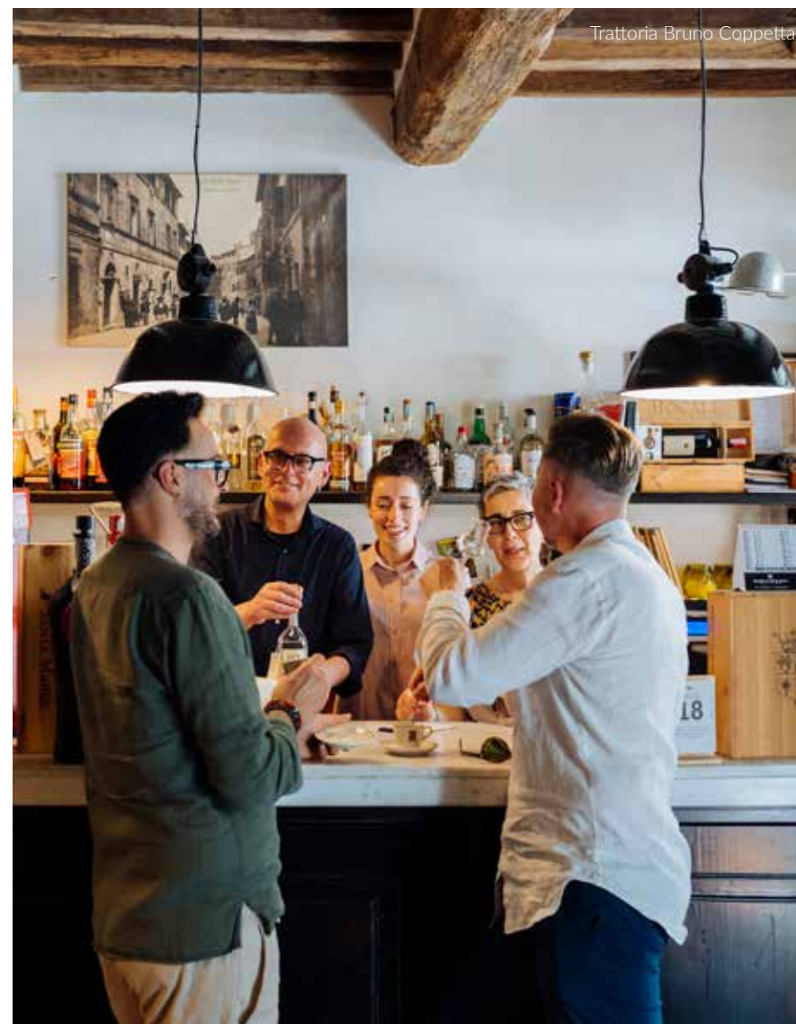
Trattoria Bruno Coppetta